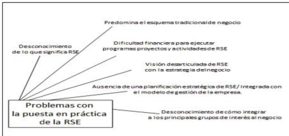
Figura 2: Factores limitantes en la implementación de la RSE

La manera en que las empresas seleccionadas gestionan la RSE se caracteriza por una aptitud filantrópica, asociada también al tamaño de la empresa, es decir, las más grandes han respondido con la creación de Fundaciones. Aquellas, en su mayoría más pequeñas, que están presionadas por ley y por los consejos comunales, muestran actividades que benefician directamente a los grupos más cercanos a las instalaciones físicas de la empresa. Estas últimas, no tienen una unidad orgánica responsable de la RSE, debido a que son actividades adicionales y no están vinculadas a la estrategia del negocio.