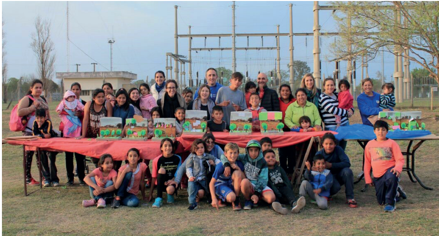
[fig. 3] Taller de diseño participativo de la plaza.

presentó a la comunidad el anteproyecto y este fue validado por los vecinos. A partir del trabajo realizado, se facilitó a los referentes de la comunidad los planos técnicos del proyecto y esto les permitió gestionar el permiso municipal para las tareas de obra, así como recibir árboles, equipamientos urbanos e iluminación.