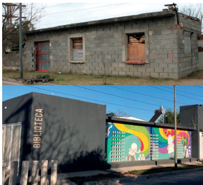
fig. 5] Espacios comunitarios transformados: Antes y después del Salón Comunitario.