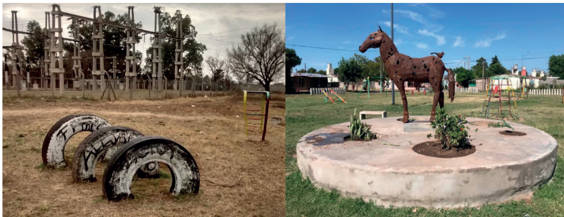
[fig. 6] Espacios comunitarios transformados: Antes y después de la Plaza La Victoria.