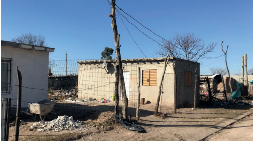
[fig. 2] Asentamiento informal Zepa B Anexo.

A través de la situación urbana del barrio observamos cómo la configuración espacial de la ciudad genera y sostiene un proceso de desigualdad social. La distancia geográfica, la falta de equipamientos y la difícil accesibilidad dan cuenta de un contexto de (in)justicia espacial 3 . Entendida esta en vinculación a las injusticias geográficas, según Pirie (1983) y Flusty (1994,) pero también siguiendo a David Harvey (1973 y 2008), como poblaciones mal situadas que resultan en efectos socio-espaciales discriminatorios. Cabe mencionar que la injusticia espacial repercute en el acceso al derecho a la ciudad, entendido con Dikee (2010) y Soja (2010), como los mismos derechos universales a acceder y usufructuar los recursos de su ciudad.