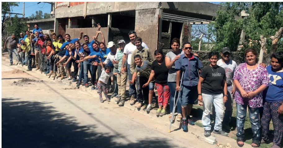
[fig. 4] Vecinos y voluntarios realizando trabajos de construcción.

se recuperaron 4.551 m 2 de espacio verde, dotándolo de equipamiento y forestación. La construcción social y material de estos espacios -a diferencia de aquellos diseñados y planificados siguiendo intereses exógenos- hizo posible la vivencia del encuentro, del consenso y de la confrontación. Este proceso resultó en instancias de aprendizaje para todos los actores involucrados que ayudaron a potenciar los recursos, el intercambio de saberes y a gestionar de manera colectiva. Por otra parte, las experiencias vividas a lo largo del proceso constructivo se incorporaron a la historia local y a su sentido de pertenencia.