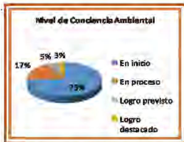
Figura N° 01. Nivel de conciencia ambiental en los estudiantes del grupo experimental de quinto grado de educación primaria de la Institución Educativa N° 10018 del distrito de Santa Rosa - 2015.