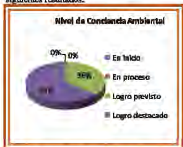
Figura N° 03. Nivel de conciencia ambiental en los estudiantes del grupo experimental de quinto grado de educación primaria de la Institución Educativa N° 10018 del distrito de Santa Rosa - 2015

Después de haber aplicado el post test a los grupos experimental y control se obtuvieron los siguientes resultados: