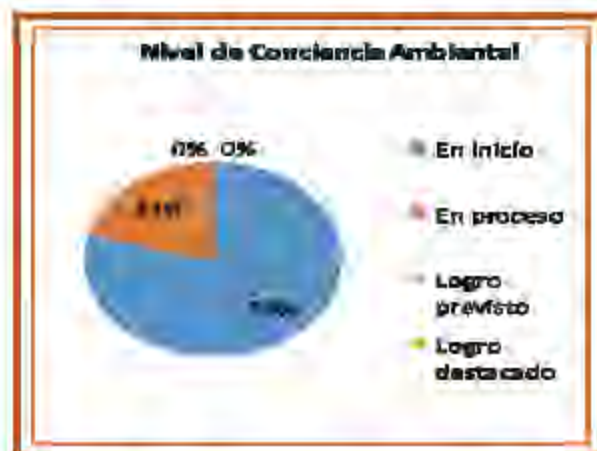
Figura N° 02. Nivel de conciencia ambiental en los estudiantes del grupo control de quinto grado de educación primaria de la Institución Educativa N° 10018 del distrito de Santa Rosa - 2015