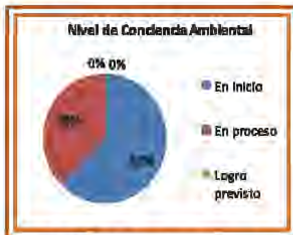
Figura N° 04. Nivel de conciencia ambiental en los estudiantes del grupo control de quinto grado de educación primaria de la Institución Educativa N° 10018 del distrito de Santa Rosa - 2015