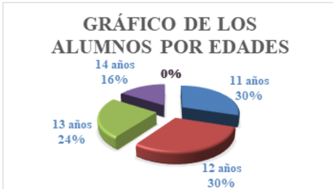
Figura 1. Distribución de alumnos por edades

En cuanto a la etapa etaria, podemos ver la figura 1 es que los alumnos con 11 y 12 años representan la mayor parte del efectivo del 6º grado representando un 30%, mientras que los de 14 años representan solo un 16% de la muestra.