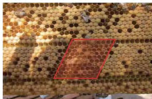
Figura N° 03. Área de cría limpia 24 horas después del pinchado.

Principal y otros (2008) sugieren como criterio para la interpretación del comportamiento