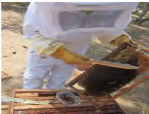
Figura N° 01. Barrido de cuadro para colecta de abejas

Para tomar el peso de las abejas, se tomaron al azar 10 abejas obreras de la colmena elegida y fueron colocadas en una botella plástica vacía.