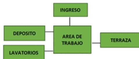
Figura 6. Organigrama para ambientes de arte manual, a partir de los datos de entrevistas aplicadas a profesionales.

Los talleres artísticos manuales deben ser