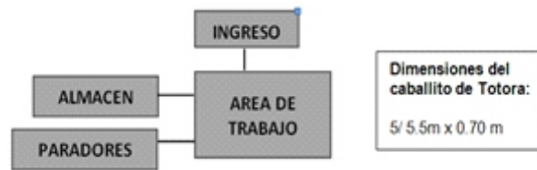
Figura 7. Organigrama para el Taller de confección de Caballitos de Totora, a partir de los datos de entrevistas aplicadas a profesionales.

el ambiente para el trabajo, la iluminación debe ser abundante y ventilación alta y cruzada para evitar que el viento obstruya y malogre el trabajo de los usuarios.