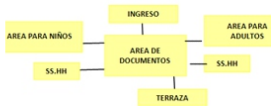
Figura 5. Organigrama biblioteca, a partir de los datos de entrevistas aplicadas a profesionales.