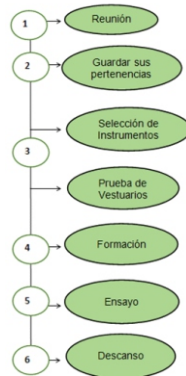
Figura 2. Proceso del desarrollo de una danza típica Huanchaquera.

esto si es necesario continúan con el ensayo o se retiran a sus viviendas.